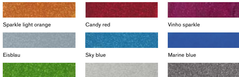
Sparkle light orange